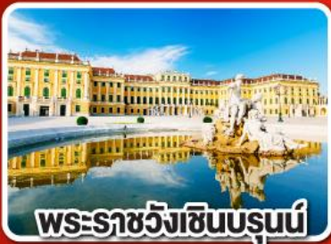
พระราชวังซินบรูนี