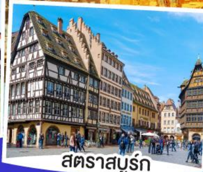
สตราสบูร์ก