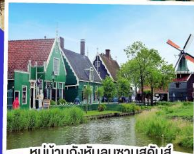
หมู่บ้านกังหันลมซานสคินส์