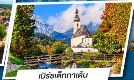
เบิร์ชเต็กกาเดิน