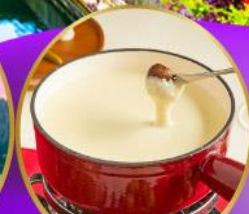
ฟองดูชีส