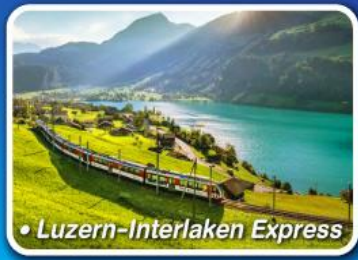
• Luzern-Interlaken Express