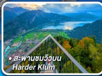
• สะพานชมวิวยิบ Harder Klum