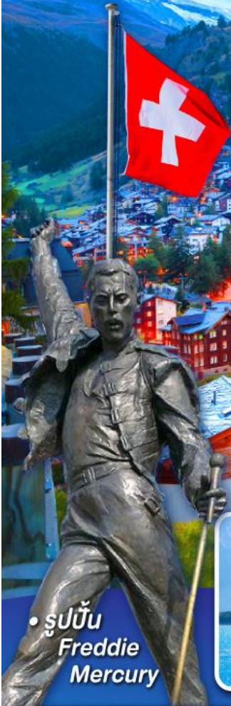
• รูปปั้น Freddie Mercury

พีชิต 5 เจริทิ, เชาฮาร์เคอร์คุม, เชาจุงเฟรา เชาคลาเชียร์ 3000 และ เชากรอนเนอร์เกรต