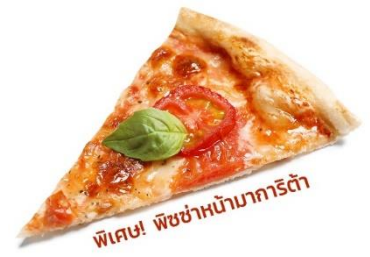
พิเศษ! พิซซ่าหน้ามาการิตต้า

(ชื่อโรงแรมที่ท่านพัก ทางบริษัทจะทำการแจ้งพร้อมใบนัดหมาย 5-7 วันก่อนวันเดินทาง)