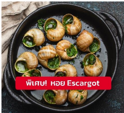
พิเศษ! หอย Escargot

📍 รับประทานอาหารเย็น (มื้อที่9) เมนูพิเศษ!! หอย Escargot