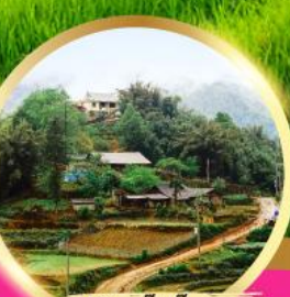
หมู่บ้านกัตกัต