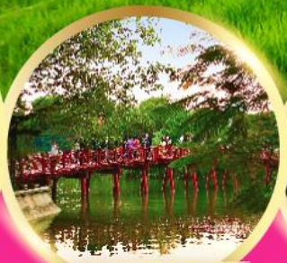
ทะเลสาบคินคาบ