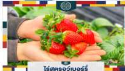
โรสตรอว์เบอร์รี่