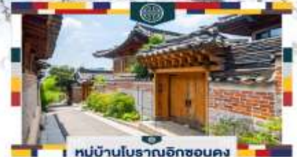
หมู่บ้านโบราณอิกซอนดง