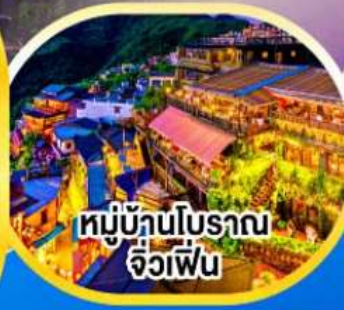
หมู่บ้านโบราณ จิวเฟิ่น