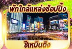
ซีเหมินติง