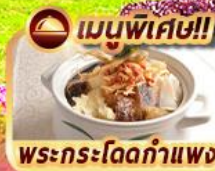
พระกระโดดกำแพง