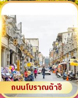
ถนนโบราณต้าชิ