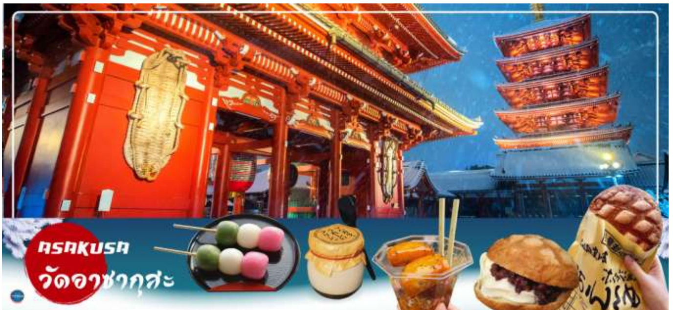
ASAKUSA วัดอาซากุสะ

วันที่ห้า กรุงโตเกียว - วัดอาซากุสะ - ช้อปปิ้งถนนนากามิเซะ - ถ่ายรูปโดเกียวสกายทรีริมแม่น้ำสุมิดะ - พระราชวังอิมพีเรียล(ด้านนอก) - สะพานแว่นดา - ย่านโอไดบะ - ห้างไดเวอร์ซิตี