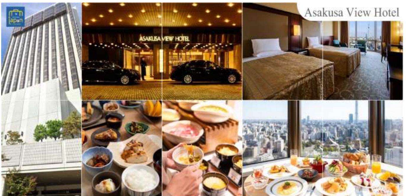
Asakusa View Hotel

เย็นพักที่ อีสาระรับประทานอาหารเย็นตามอัธยาศัย ASAKUSA VIEW HOTEL หรือเทียบเท่าระดับเดียวกัน