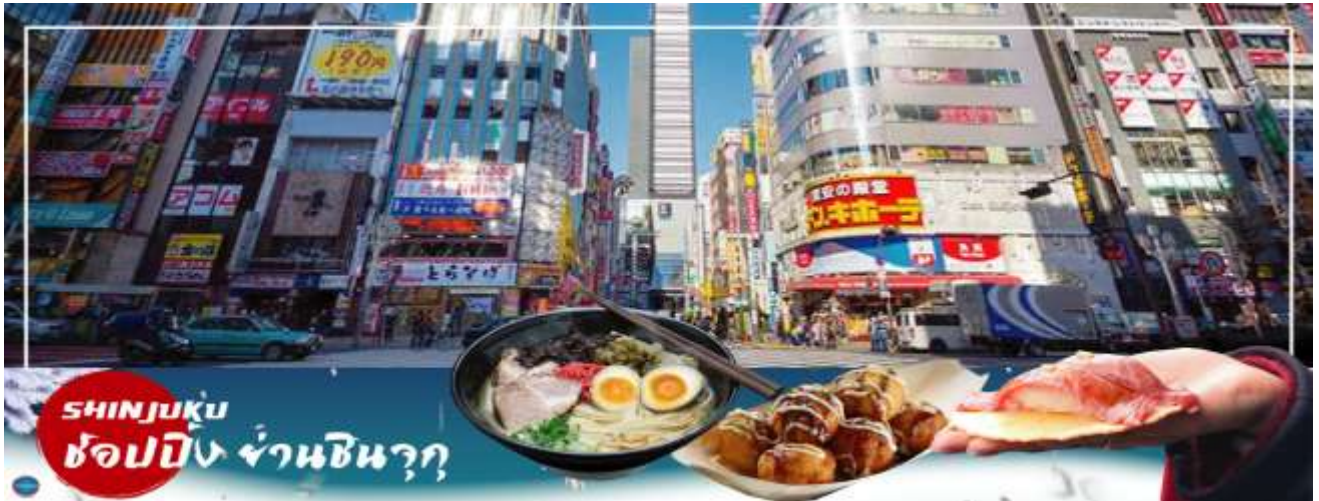
SHINJUKU ช้อปปิ้ง ย่านชินจูกุ

เย็น อิสระรับประทานอาหารเย็นตามอัธยาศัย พักที่ ASAKUSA VIEW HOTEL หรือเทียบเท่าระดับเดียวกัน