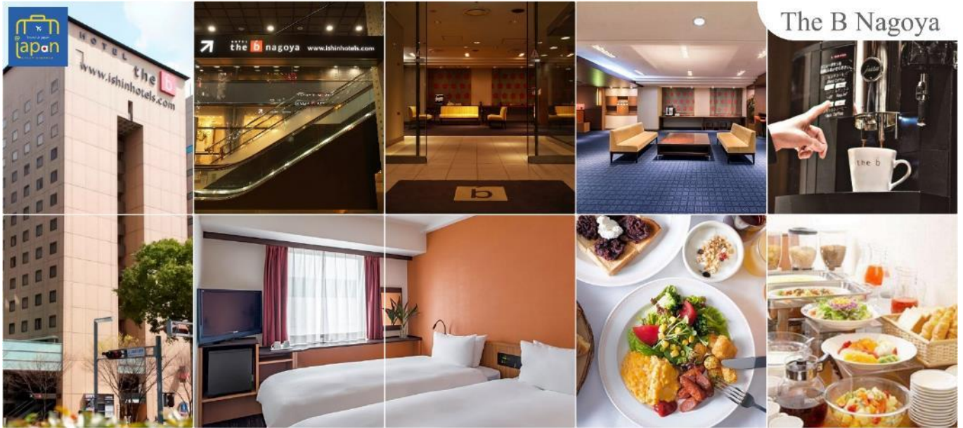
The B Nagoya

อิสระให้ท่านเดินเล่นช้อปปิ้ง ย่านซาคาเอะ (Sakae) เป็นย่านธุรกิจการค้า โดยเฉพาะแหล่งราตรี เช่น คลับและบาร์ มีห้างสรรพสินค้ามีดส์ซาคายะ หรือ เมืองไต้ดิน (Central Park) แหล่งรวมแฟชั่น และร้านค้าสุดเก๋มากมาย เช่น ร้านเสื้อผ้า, ร้านของใช้กระจุกกระจิก, ร้านชาลอนความงาม เป็นต้น แฟนๆไอดอลญี่ปุ่น ห้ามพลาด ต้องมาเยือนห้างสรรพสินค้าชั้นไซน์ ซาคาเอะ ซึ่งเป็นจุดศูนย์กลาง แหล่งรวมความบันเทิงมากมาย ที่มี Grand Canyon ฮอลล์จัดคอนเสิร์ตศิลปินไอดอลและยังเป็นคาเฟ่ นอกจากนี้ที่นี่ยังเป็นสถานที่ตั้งของ "ชิงช้าสวรรค์ Sky Boat" แลนด์มาร์คของย่านนี้อีกด้วย อิสระเพลิดเพลินย่านนี้ตามอัธยาศัย