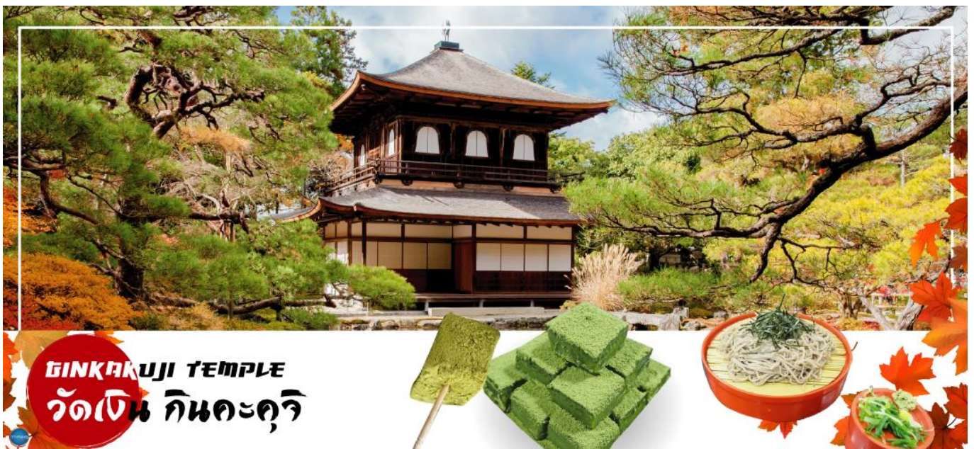
GINKAKUJI TEMPLE วัดเงิน กินคะคุจิ

วันที่ห้า เมืองนาโกย่า – เมืองเกียวโต – วัดกินคะคุจิ หรือ วัดเงิน – พิธีชงชาญี่ปุ่น – เมืองโอซาก้า – LALAPORT & MITSUI OUTLET PARK OSAKA KADOMA – ช้อปปิ้งย่านชินไซบาชิ