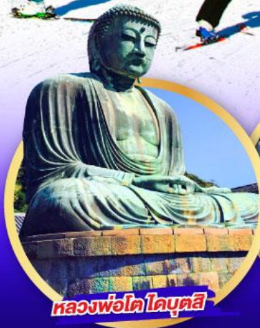
หลวงพ่อโต โดบุตสึ