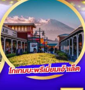
โกเทมบะพรีเมียมเอ้าลิต

เดินทาง 14-19 ม.ค. 68 21-26 ม.ค. 68 28 ม.ค.-02 ก.พ. 68