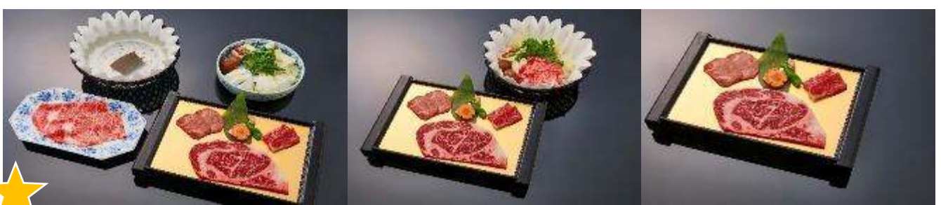
★ ROKKASEN มีอพิเชษกับบุฟเฟ่ต์ปิ้งย่างพรีเมียมพร้อม SOFT DRINK แบบไม่อั้น!!!