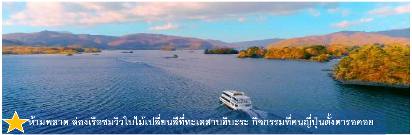
★ ห้ามพลาด ล่องเรือชมวิวใบไม้เปลี่ยนสีที่ทะเลสาบฮิบะระ กิจกรรมที่คนญี่ปุ่นตั้งตารอคอย