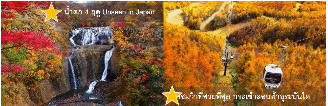
★ น้ำตก 4 ฤดู Unseen in Japan