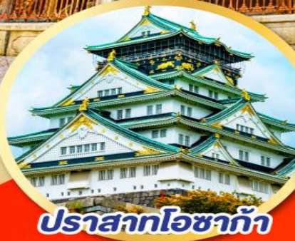
ปราสาทโอซาก้า