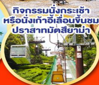
กิจกรรมนั่งกระเช้า หรือนั่งเก้าอี้เลื่อนขึ้นชม ปราสาทมัตสึยาม่า