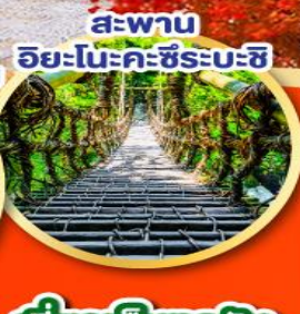
สะพาน อิยะโนะคะชิระบะชิ