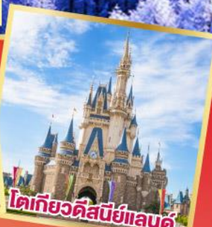
โตเกียวดิสนีย์แลนด์

อิสระท่องเที่ยว 1 วันเต็มในโตเกียว หรือซื้อทัวร์เสริม Tokyo Disneyland