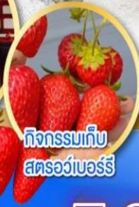
กิจกรรมเก็บ สตรอว์เบอร์รี่

เดินทาง 17-22, 24-29 ม.ค. 68 31 ม.ค.-05 ก.พ. 68 04-09, 07-12 ก.พ. 68 (วันหยุดวันมาฆบูชา) 14-19, 21-26 ก.พ. 68 04-09, 07-12, 11-16 มี.ค. 68