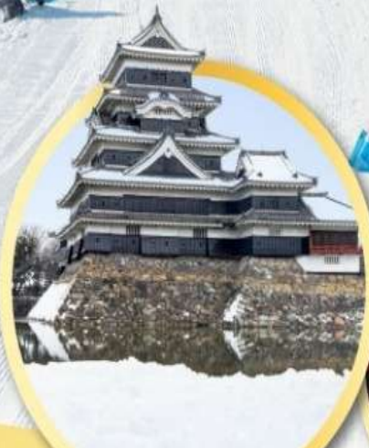
ปราสาทมัตสึโมโตะ

ชมวิวกุเอาไฟฟูจิริมทะเลสาบคาวากูจิโกะ พักโรงแรมโตเกียว 1 คืน พักออนเซ็น 2 คืน เที่ยวเต็มทุกวันไม่มีฟรีคีย์ เข้าไอซาก้า ออกโตเกียว