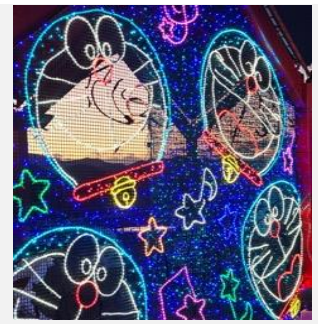
SAGAMIKO ILLUMILLION เพลิดเพลินไปกับงานประดับไฟที่ใหญ่ที่สุดในญี่ปุ่น

ซากามิโกะ หรือ งานประดับไฟฤดูหนาวที่ยิ่งใหญ่ของญี่ปุ่น ที่จะพาเราตื่นตาตื่นใจไปกับสวนที่ประดับไฟ LED กว่าหกล้านดวง เปลี่ยนสวนสนุกให้กลายเป็นดินแดนมหัศจรรย์ที่เต็มไปด้วยแสงสี ให้เราได้สัมผัสกับบรรยากาศโรแมนติกและเต็มไปด้วยความสนุกสนาน ผ่านโซนต่าง ๆ ที่ตกแต่งด้วยธีมหลากหลาย เช่น อุโมงค์ไฟ ป่าเรืองแสง และปราสาทเทพนิยาย ไฮไลท์ของงานคือ "Rainbow Lift" ซึ่งเป็นกระเช้าลอยฟ้าพร้อมพาชมวิวทิวทัศน์ของสวนที่ประดับไฟอย่างงดงามในมุมกว้าง นอกจากนี้ ยังมีกิจกรรมสนุก ๆ เช่น สวนสนุกขนาดย่อม และร้านอาหารที่ให้บริการ ทำให้คุณสามารถเพลิดเพลินดื่มด่ำกับความงดงามและบรรยากาศฤดูหนาวในญี่ปุ่นที่แสนพิเศษ