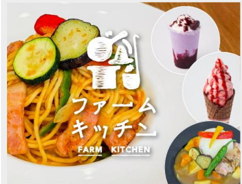
ผ่อนคลายที่ฟาร์มคาเฟ่ แวะเก็บสตอร์วเบอร์รี่ทานกันสด ๆ จากสวน

สัมผัสบรรยากาศธรรมชาติที่สดชื่นกันที่ ฟาร์มคาเฟ่ ขวนเก็บสตอร์วเบอร์รี่สด ๆ จากต้น (ไม่รวมค่าเก็บสตอร์วเบอร์รี่) ที่ทั้งหวานฉ่ำและกรอบอร่อยในช่วงฤดูหนาว นอกจากนี้เชิญชวนเยี่ยมชมและผ่อนคลายกันในคาเฟ่ที่เสิร์ฟทั้งอาหารและของหวานที่ทำจากวัตถุดิบสดใหม่ ส่งตรงจากฟาร์ม ที่จะทำให้ทุกคนประทับใจไปกับสวนฟาร์มคาเฟ่แห่งนี้