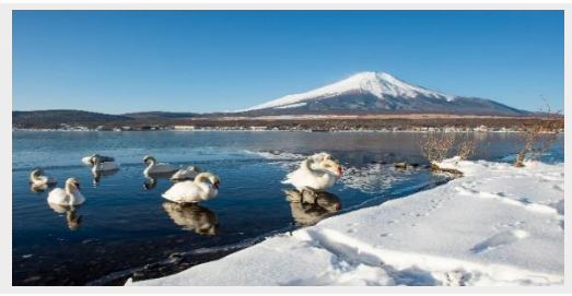
OSHINO HAKKAI หมู่บ้านน้ำใส - LAKE KAWAGUCHIKO

โอชิโนะ ฮักโก หรือ ที่รู้จักกันในชื่อ หมู่บ้านน้ำใส ความงามแห่งธรรมชาติและวัฒนธรรมที่ซ่อนอยู่ใต้เงาภูเขาไฟฟูจิ ตั้งอยู่ในหมู่บ้านโอชิโนะ จังหวัดยามานาชิ เป็นแหล่งน้ำธรรมชาติที่มีชื่อเสียง ประกอบด้วยบ่อน้ำใสสะอาดทั้งแปดแห่ง ซึ่งน้ำในบ่อเหล่านี้เกิดจากการละลายของหิมะและน้ำแข็งจากภูเขาไฟฟูจิ น้ำที่ไหลลงมารองผ่านชั้นหินภูเขาไฟ จนทำให้น้ำในบ่อมีความบริสุทธิ์และใสจนเห็นถึงก้นบ่อ ไม่เพียงแต่ความงามของธรรมชาติที่ทำให้ โอชิโนะ ฮักโก เป็นที่รู้จัก หมู่บ้านนี้เป็นสถานที่ที่เราสามารถสัมผัสวัฒนธรรมญี่ปุ่นที่แท้จริง จึงเป็นหนึ่งในจุดหมายที่ไม่ควรพลาดเมื่อมาเยือนญี่ปุ่น