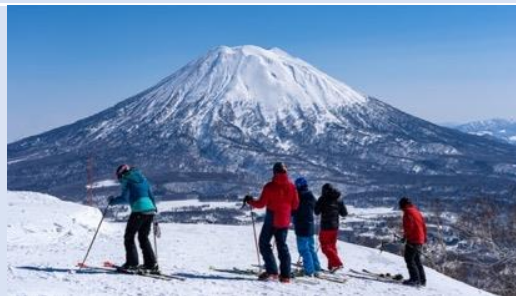
Fujiten Snow Resort เช็คอินลานสกี ฟุจิเท็น สโนว์ รีสอร์ท

สัมผัสความเย็น ณ ลานสกีที่ต้องไปเยือนในฤดูหนาวนี้ กับ ลานสกีฟูจิเท็น ที่มีวิวอันงดงามของภูเขาไฟฟูจิที่ปกคลุมไปด้วยหิมะ และความสนุกสนานของการเล่นสกี รีสอร์ทแห่งนี้มอบทั้งความสนุกสนานในหิมะและวิวที่สวยงามเกินบรรยาย ลานสกีฟูจิเท็น มีลานสกีและสโนว์บอร์ดที่หลากหลาย มีพื้นที่เล่นหิมะที่ปลอดภัยสำหรับเด็กๆ ที่จะเพลิดเพลินกับการเล่นสไลด์และถาดเลื่อนหิมะ นอกจากนี้ยังมี การเรียนสกีและสโนว์บอร์ดสำหรับทุกคนในครอบครัวเหมาะสำหรับทั้งผู้เริ่มต้นและนักสกี หรือ สโนว์-บอร์ด ระดับมืออาชีพ ได้ทั้งความเพลิดเพลินและบรรยากาศที่สวยงามของฤดูหนาวและวิวสวยอลังการของภูเขาไฟฟูจิ ความสนุกสนานของการเล่นสกี หรือจะถ่ายรูปเช็คอินกับหิมะเก็บความทรงจำ