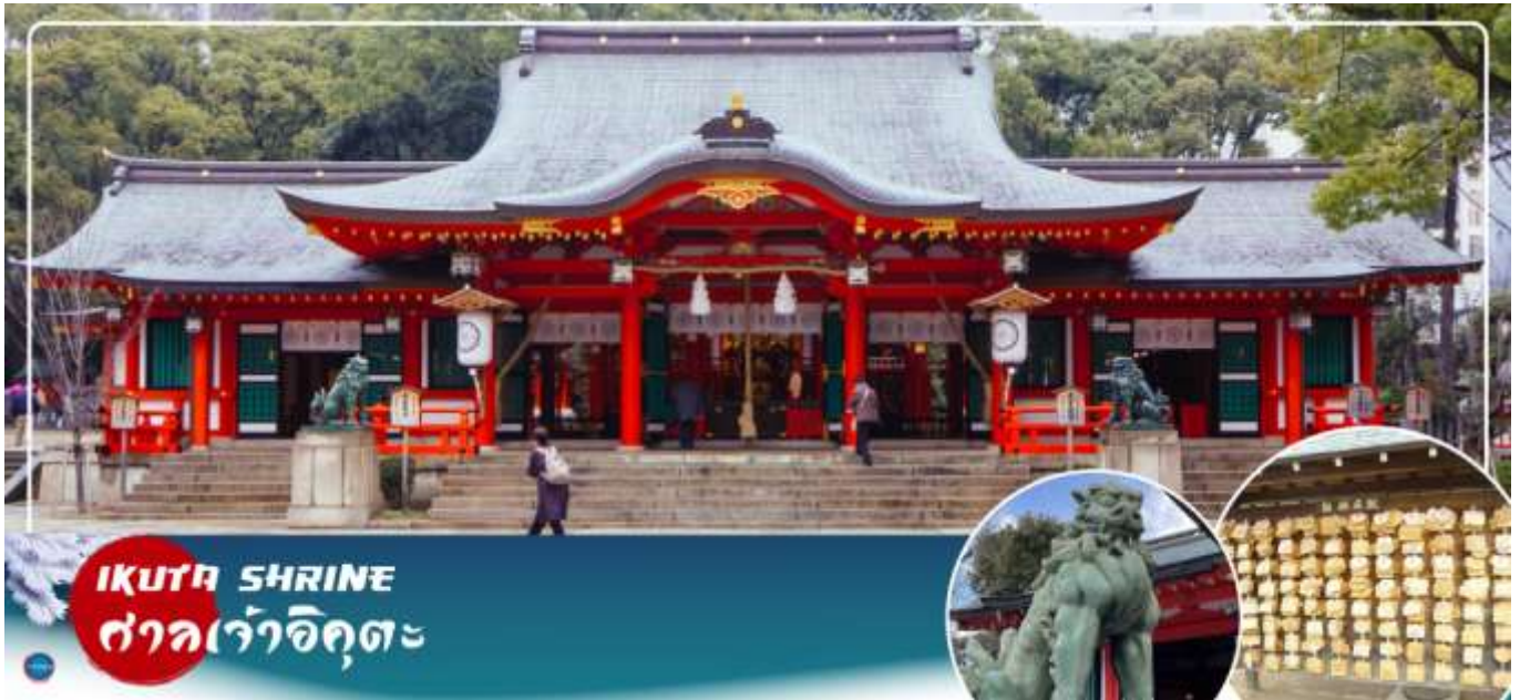
IKUTA SHRINE ศาลเจ้าอิคุตะ

จากนั้นนำท่านสักการะ ศาลเจ้าอิคุตะ (Ikuta Shrine) ตั้งอยู่ในย่านใจกลางเมืองซันโนะมียะ (Sannomiya) เป็นศาลเจ้าที่มีประวัติศาสตร์ยาวนาน ก่อตั้งในปี 201หนึ่งในสามศาลเจ้าหลักของโกเบที่มีประวัติศาสตร์ยาวนานกว่า 1,800 ปีทางเหนือไปตามถนนชื่อถนนอิคุตะ คุณจะเห็นทางเข้าศาลเจ้าพร้อมประตูโทริอิที่สร้างโดยใช้วัสดุรีไซเคิลจากศาลเจ้าใหญ่อิเสะศาลเจ้าอิคุตะมีชื่อเสียงในด้านผลประโยชน์ในการจับคู่ เนื่องจากจิตตาสี อนุชนเป็นเทพเจ้าผู้ทอเสื้อผ้าของเทพเจ้า และเธอทอผ้าและด้ายเข้าด้วยกัน คนในพื้นที่เรียกกันอย่างเสนหาวว่า "อิคุตะซัง"