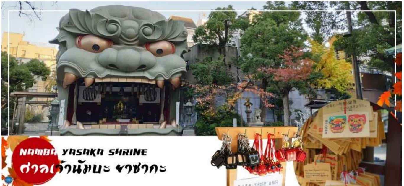
NAMBA YASAKA SHRINE