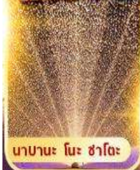
นาบานะ โนะ ซาโตะ