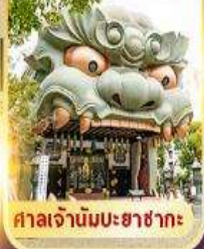
ศาลเจ้านิมบะฮาซากะ