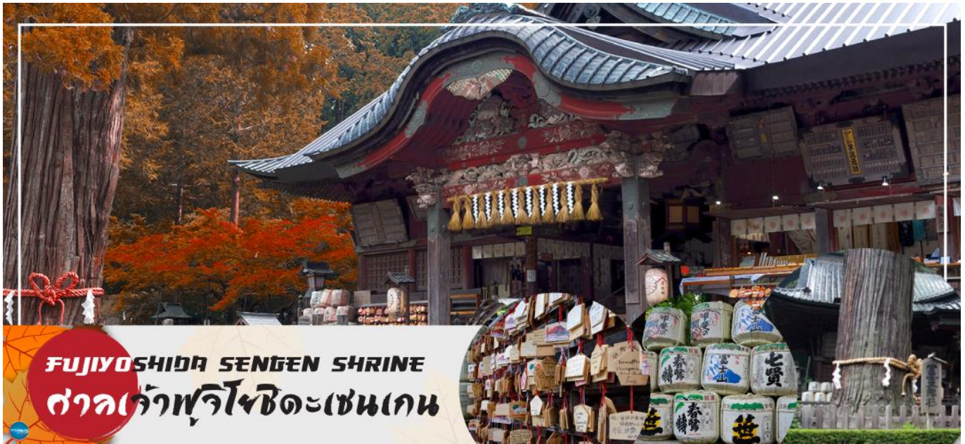
FUJIYOSHIDA SENGEN SHRINE ศาลเจ้าฟูจิโงชิเดะเซนเกน