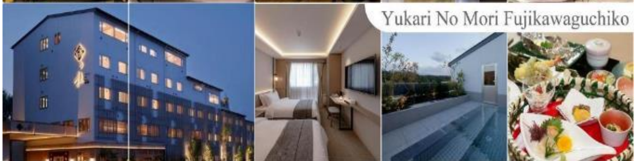
Yukari No Mori Fujikawaguchiko