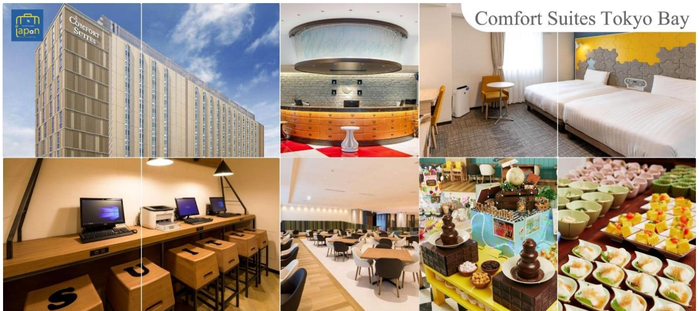
Comfort Suites Tokyo Bay

NiceTripExcursion / ทัวร์ไทยลึกลับราคา / ทัวร์ถูกทัวร์สุดยอด