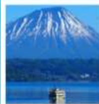
ค่องเรือทะเลสาบไทย