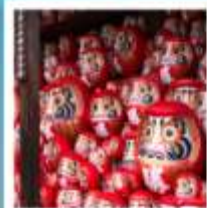
วัดคัตสึโฮจิ