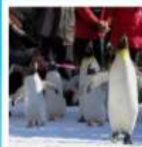
สวนสัตว์นิกะฮะ

วัดคัตสึโฮจิ / ปราสาทโอซาก้า / ย่านชินไซบาชิ ค่องเรือทะเลสาบไทย / ไทริยอกะกุ ทาวเวอร์ ทัศนียภาพทะเลสาบไบวารี / นิงงะฮะซาฮะซาฮะโกดะเอะ ตลาดเช้าเมืองฮาโกดะเอะ / สวนสัตว์นิกะฮะ มารีนาพาร์ค พิพิธภัณฑ์หอคอยดนตรี / นาฬิกาไอน้ำโบราณ โรงเป่าแก้วคัตสึโฮจิ / เนินพระพุทธรูป / มิซึฮาเอะสิเค็ด