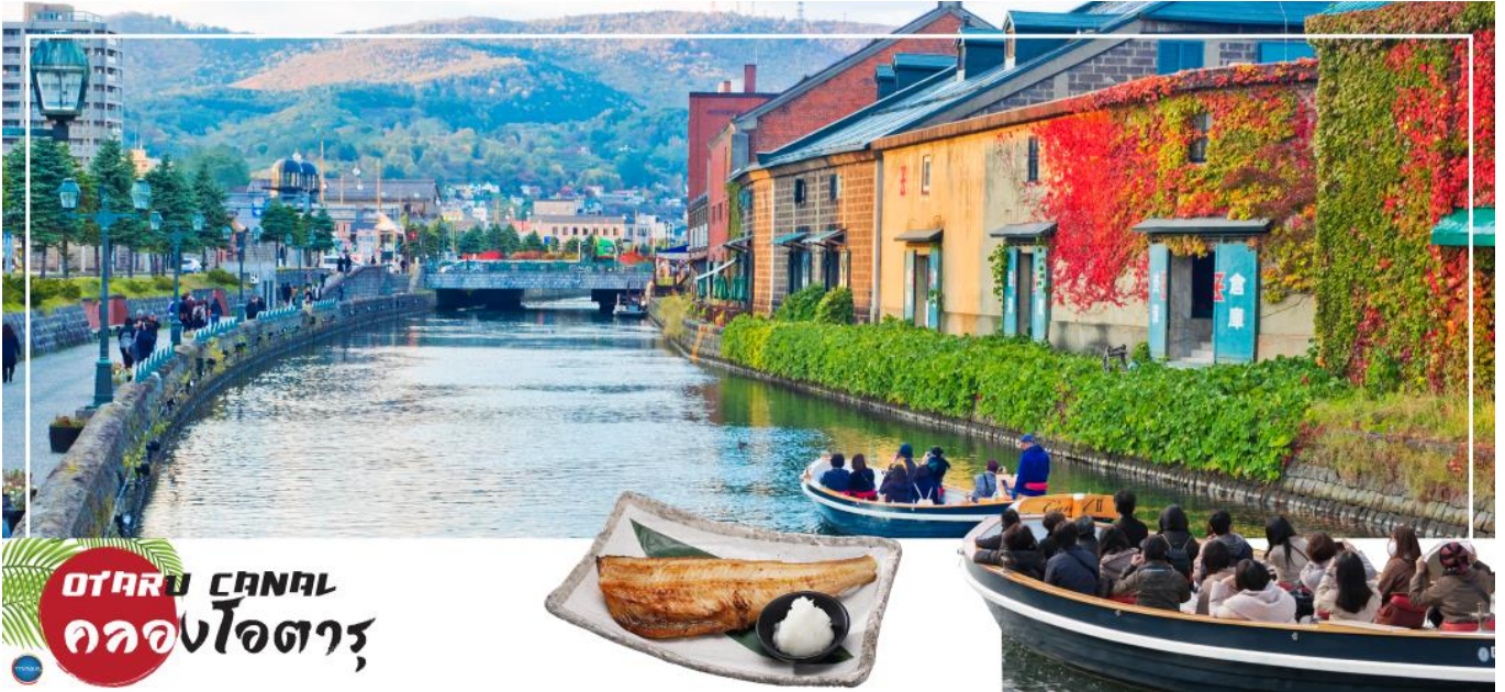
OTARU CANAL คลองโอตารุ

เดินชม คลองโอตารุ (Otaru Canal) หรือ โอตารุอุโมงค์ มีความยาว 1.5 กิโลเมตร ถือเป็นสัญลักษณ์ของเมืองโอตารุ โดยมีโกดังเก่าบริเวณโดยรอบปรับปรุงเป็นร้านอาหารเรียงรายอยู่ ไฮไลท์!!! บรรยากาศสุดแสนโรแมนติก คลองแห่งนี้สร้างเมื่อปี 1923 โดยสร้างขึ้นจากการถมทะเล เพื่อใช้สำหรับเป็นเส้นทางขนถ่ายสินค้ามาเก็บไว้ที่โกดัง แต่ภายหลังได้เลิกใช้และมีการถมคลองครึ่งหนึ่งเพื่อทำถนนหลวงสาย 17 แล้วเหลืออีกครึ่งหนึ่งไว้เป็นสถานที่ท่องเที่ยว มีการสร้างถนนเรียบคลองด้วยอิฐแดงเป็นทางเดินเท้ากว้างประมาณ 2 เมตร