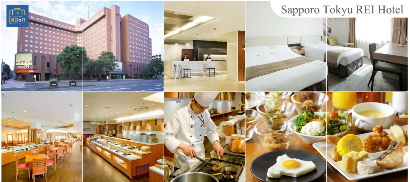
Sapporo Tokyu Rei Hotel

SAPPORO TOKYU REI HOTEL หรือเทียบเท่าระดับเดียวกัน