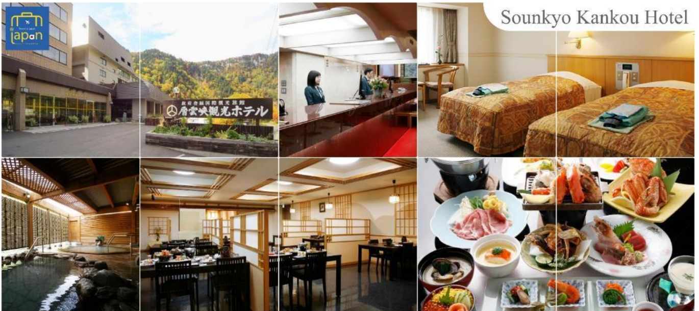
Sounkyo Kankou Hotel

หลังอาหารให้ท่านได้ผ่อนคลายกับการแช่น้ำแร่ธรรมชาติ (ออนเซน) เชื่อว่าถ้าได้แช่น้ำแร่แล้ว จะทำให้ผิวพรรณสวยงามและช่วยให้ระบบหมุนเวียนโลหิตดีขึ้น