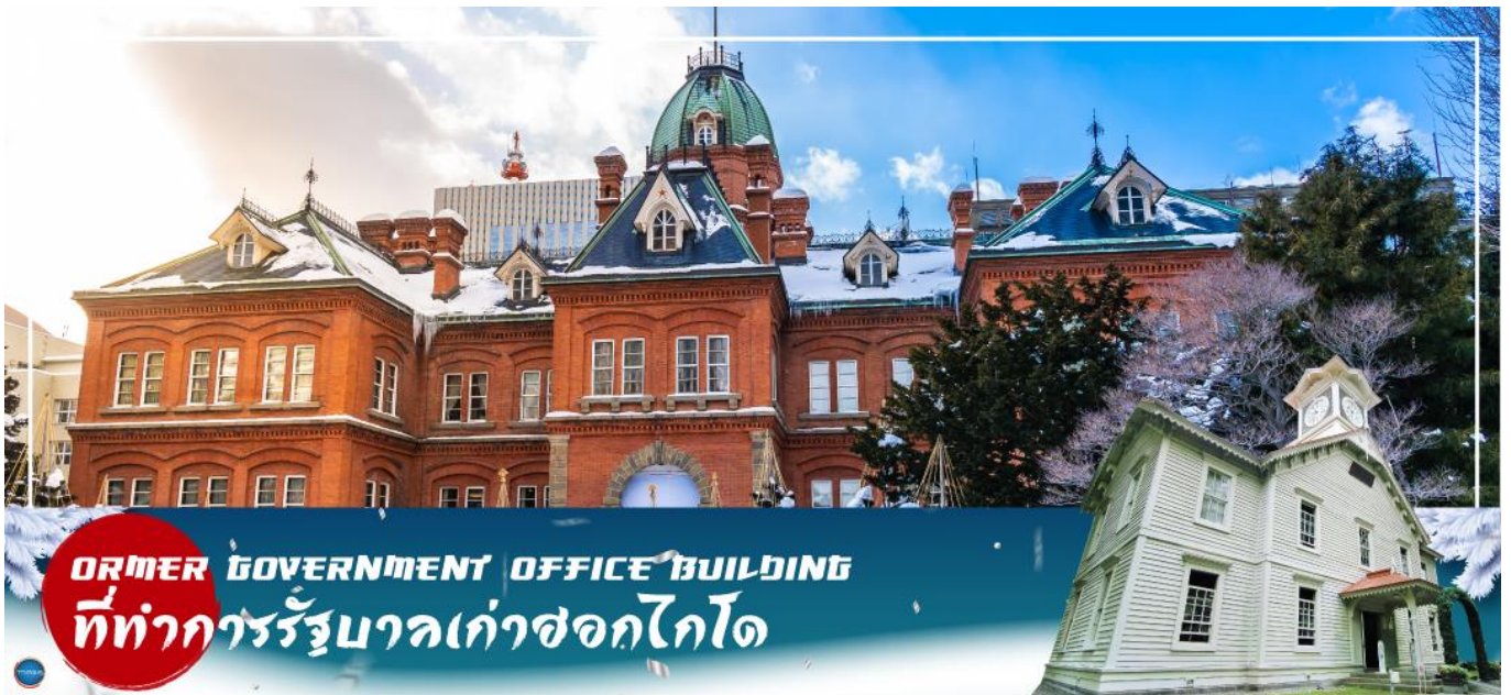
FORMER GOVERNMENT OFFICE BUILDING ที่ทำการรัฐบาลเก่าซอกไกโด

เมืองซัปโปโร – ดิวตี้ฟรี – ผ่านชม ศาลาว่าการเมืองซอกไกโดหลังเก่า – ผ่านชม หอนาฬิกาเมืองซัปโปโร – เมืองอาซาฮิคาว่า – โชซุนเคียว – ภูเขาคูโรดากะ (นั่งกระเช้า)**ขึ้นอยู่กับสภาพอากาศ** – ออนเซน