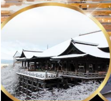
วัด คิโยมิสึ