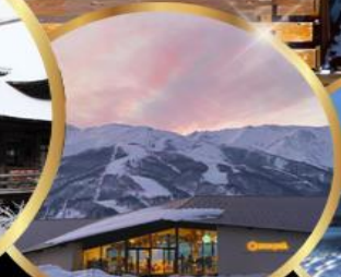
Snow peak land hukuba