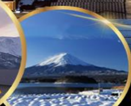
สวน โออิชิ พาร์ค

ราคา เริ่มต้น 55,919 บาท รวมภาษีมูลค่าเพิ่ม 7%