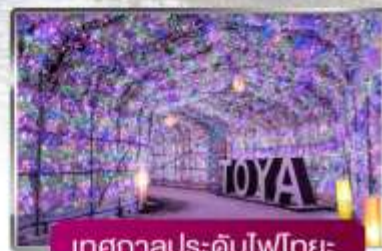
เทศกาลประดับไฟไทยะ