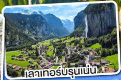
เลาเกอร์บรุนเนน