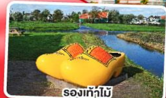
รองเท้าไม้