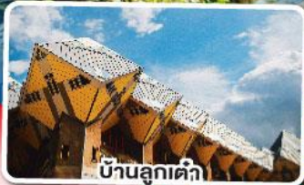
บ้านลูกเต้า