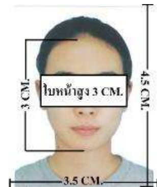
ตัวอย่างรูป