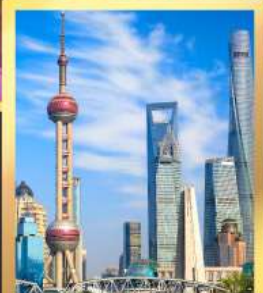
เซี่ยงไฮ้