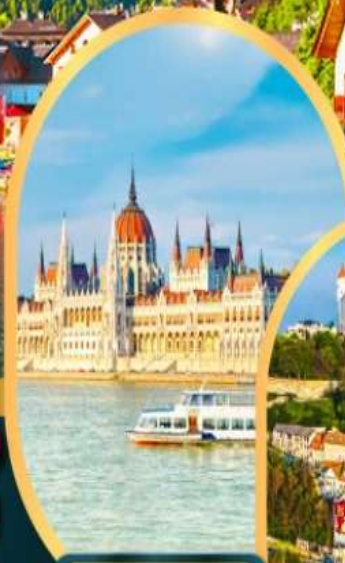
ล่องเรือแม่น้ำดานูบ