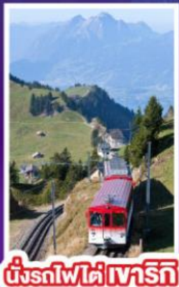
นั่งรถไฟใต้เขาเวริค