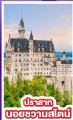
ปราสาท นอยชวานสไตน์