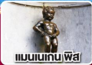
แมนเนเกน พิส