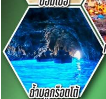
ถ้ำบลูริออตโต้