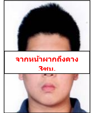
จากหน้าผากถึงคาง 3 ซม.