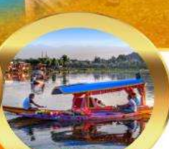
ล่องเรือซิคาร์่า