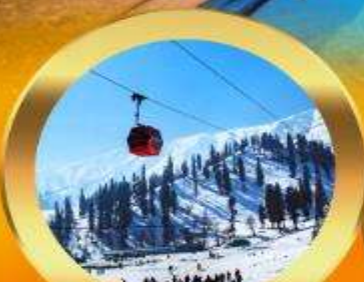
เคเบิลคาร์ กุลมาร์ค