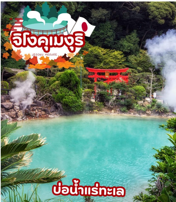
บ่อน้ำแร่ทะเล

ชม จิโงคุมะงุริ (JIGOKU MEGURI) ซึ่งประกอบไปด้วยบ่อน้ำแร่สีส้มแปลกตาทั้งหมด 8 บ่อ (ไกด์จะพาท่านเยี่ยมชม 3 บ่อ) ที่เกิดจากการรังสรรค์ขึ้นโดยธรรมชาติแต่ละบ่อมีความร้อนสูงเกินกว่า 100 องศาเซลเซียส ด้วยสีส้มและความร้อนชนิดที่มนุษย์ธรรมดาไม่อาจลงไปสัมผัสได้ จึงถูกกล่าวขานว่าเป็นเสมือน “บ่อน้ำแร่นรก” ดังนั้น ที่นี่จึงมีตัวมาสคอตเป็นยมทูตน้อยคอยให้การต้อนรับทุกคนที่มาเยือน