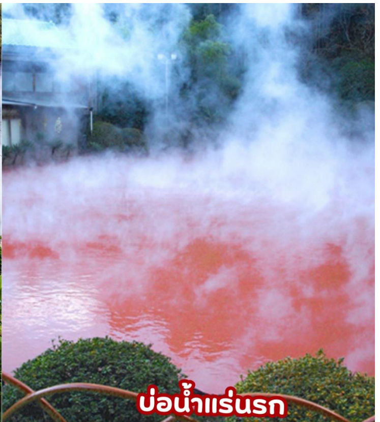
บ่อน้ำแร่นรก

ค่า ๑๑ รับประทานอาหาร (มือที่7) ณ ห้องอาหารของโรงแรม