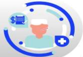
กรณีเจ็บป่วย:

กรณีเจ็บป่วยจนไม่สามารถเดินทางได้ ต้องมีใบรับรองแพทย์จากโรงพยาบาล บริษัทฯ จะทำการเลื่อนการเดินทางของท่านไปยังคณะต่อไป ทั้งนี้ ท่านจะต้องเสียค่าใช้จ่ายที่ไม่สามารถยกเลิก หรือเลื่อนการเดินทางได้ตามความเป็นจริง