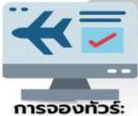
การจองทัวร์: