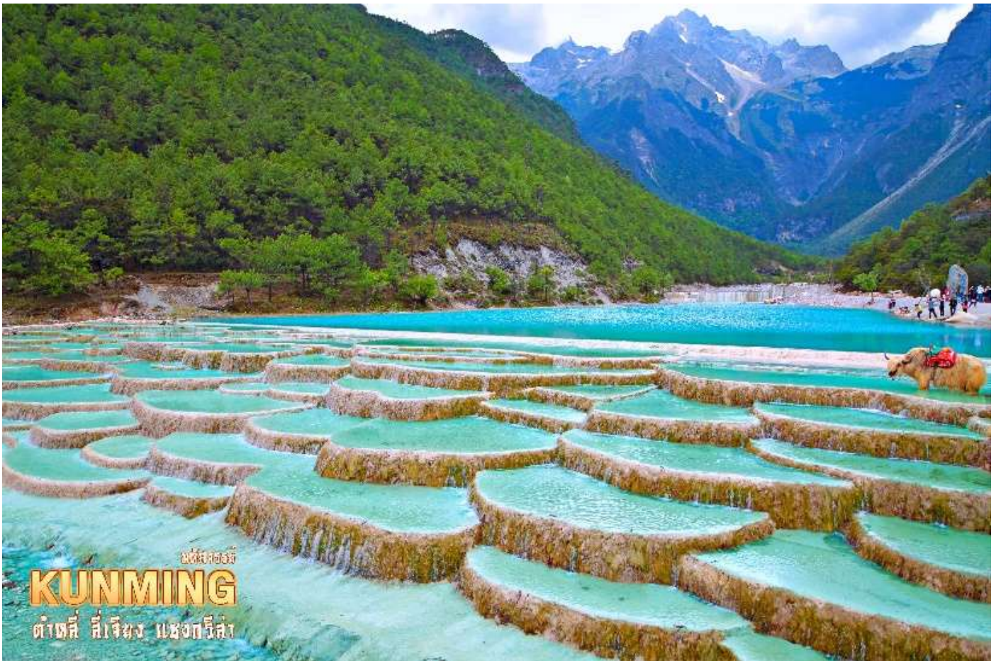
มณฑลยูนนาน KUNMING ต้าชี่ ลี่เจียง แฉงกั๋วลี้

อิสระถ่ายรูปเก็บความประทับใจอย่างเต็มอิ่ม และชมความงดงามผืนน้ำสีเทอควอยซ์ของ ทะเลสาบไปสุยเหอ ทะเลสาบที่อยู่อีกด้านหนึ่งของภูเขาหิมะมังกรหยก น้ำในทะเลสาบแห่งนี้ไหลลงมาจากการละลายของหิมะบนภูเขาหิมะมังกรหยก สามารถเติมชมความสวยของทะเลสาบได้ตลอดระยะทาง 3 กิโลเมตร หรือจะเลือกนั่งรถรับส่งได้ตามสะดวกไปยังจุดท่องเที่ยวยอดนิยม (รวมค่ารถแบตเตอร์) ระหว่างทางเดินเลียบทะเลสาบจะพบเห็นคู่รักชาวจีนที่นิยมมาถ่ายพรีเวดดิ้ง และมีเจ้าหน้าที่คอยพาจามริมาบริการให้นักท่องเที่ยวได้ถ่ายรูป (ไม่รวมค่าบริการถ่ายรูป ราคาประมาณ 50 หยวน)