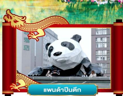
แพนด้าปิ่นดัก