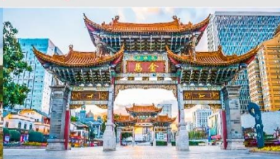
ประตู่ม้าทอง ไก่หยก