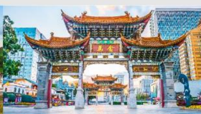
ประตูม้าทอง ไท่หยก