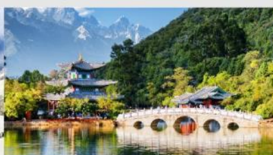
สระมิงกรดำ

*ทางบริษัทฯ ขอสงวนสิทธิ์ในการสลับโปรแกรมทัวร์ตามความเหมาะสมขึ้นอยู่กับสถานการณ์หน้างาน โดยคำนึงถึงผลประโยชน์ของลูกค้าเป็นสำคัญ