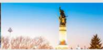
อนุสาวรีย์ฝังหอง