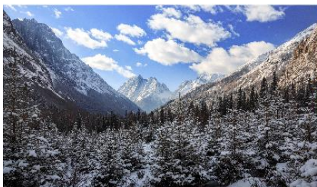
กุเขาสีดรุณี