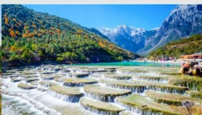
ทะเลสาบไป๋สู่ยเหอ