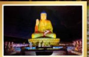
กุเวาจี่นฝ่อซาน