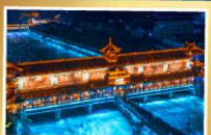
สะพานานเหี้ยว