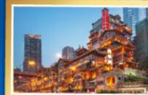
หยงหยาศี่ง