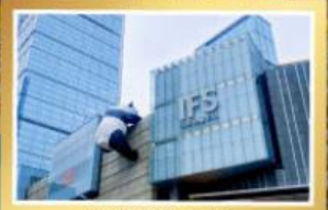
เพนค้ายี่งปี่นสี่ก IFS