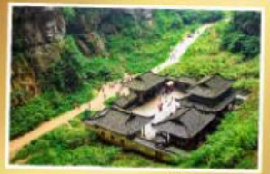
จุดยานหลูบ่งฟ้า