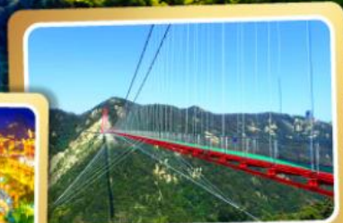
สะพานแขวนอ้ายจ้าย