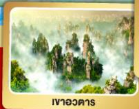
เขาอวตาร