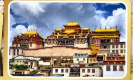
วัดลามะซงจ้านหลิง