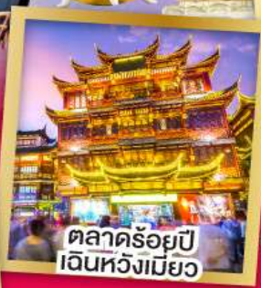
ตลาดร้อยปี เดินหัวงเมียว