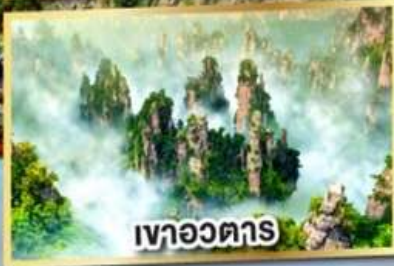
เวาอวตาร